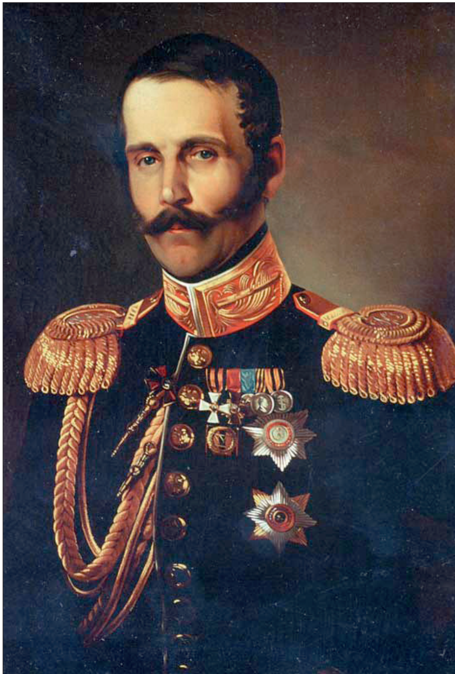
Граф Сергей Григорьевич Строганов

Павел (1774—1817) не мог не получить прекрасного образования при таком отце. Он был блестящим и влиятельным придворным, одним из советников императора Александра I. Обладая ясным умом, он вошел вместе с Кочубеем и Новосильцевым в «Комитет общественной безопасности» и разрабатывал проекты необходимых реформ. Впоследствии он состоял на дипломатической службе. В 1807 году, во время шведской войны, будучи сенатором и занимая очень высокое положение, он добровольцем вступил в ряды лейб-гвардии. Являясь командиром гренадерского полка, он продемонстрировал немало мужество, а позже принимал участие в сражениях с французами при Бородино, Краоне и Париже. Его един-